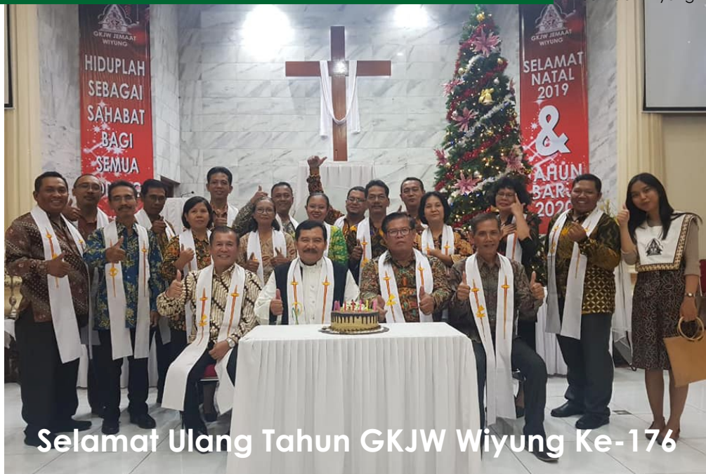
Selamat Ulang Tahun GKJW Wiyung Ke-176