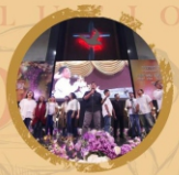
JAVA PRAISE CHOIR