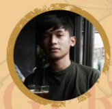
ABRAHAM - 3 COFFEE