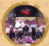
JAVA PRAISE CHOIR