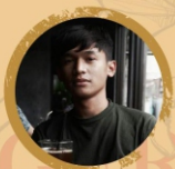
ABRAHAM - 3 COFFEE