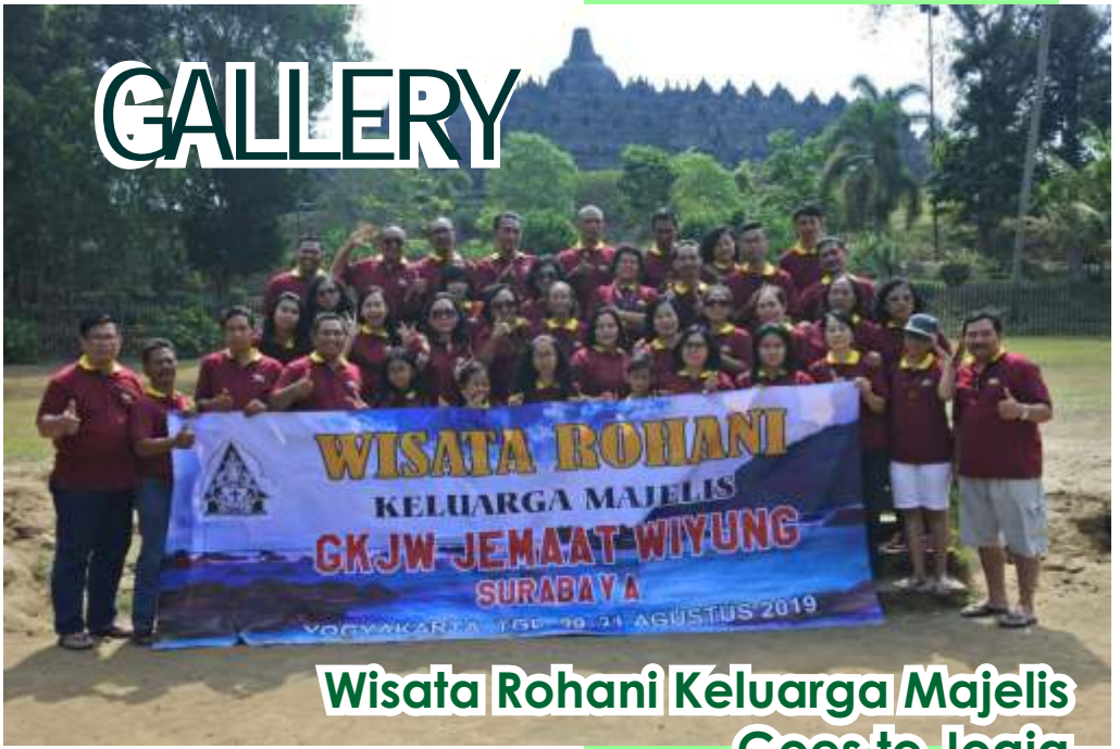
Wisata Rohani Keluarga Majelis Goes to Jogja 29-31 Agustus 2019