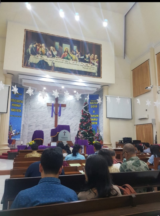
Natal KPAY 2018