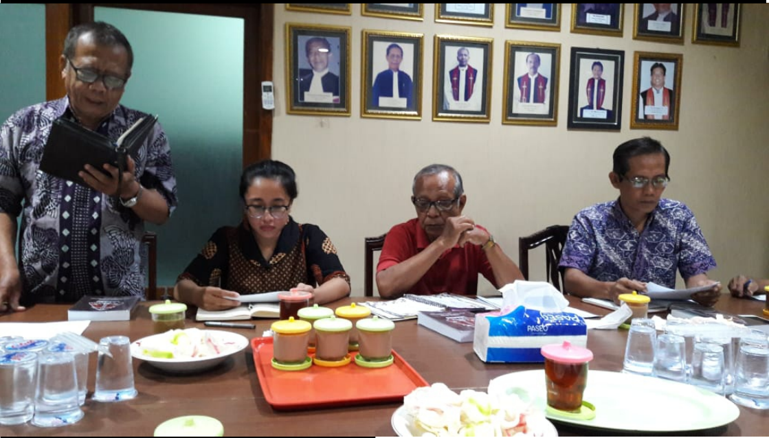
Rapat PHMJ Akhir Tahun 2018