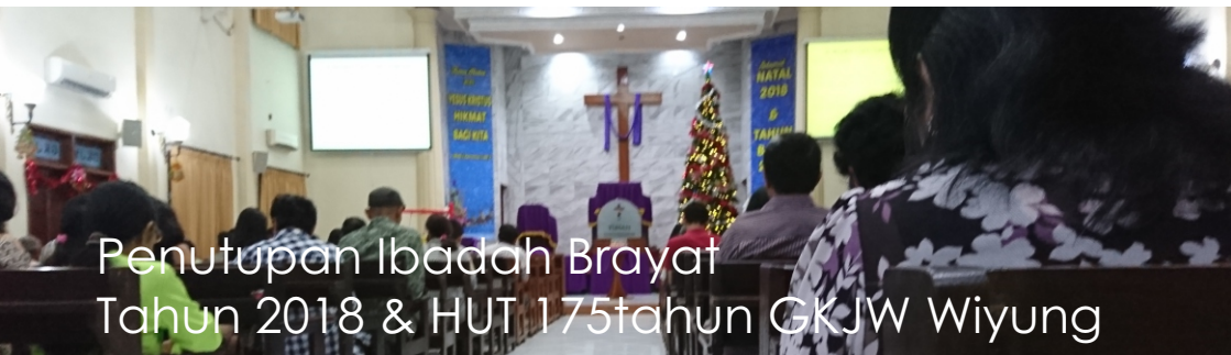
Penutupan Ibadah Brayat Tahun 2018 & HUT 175 tahun GKJW Wiyung