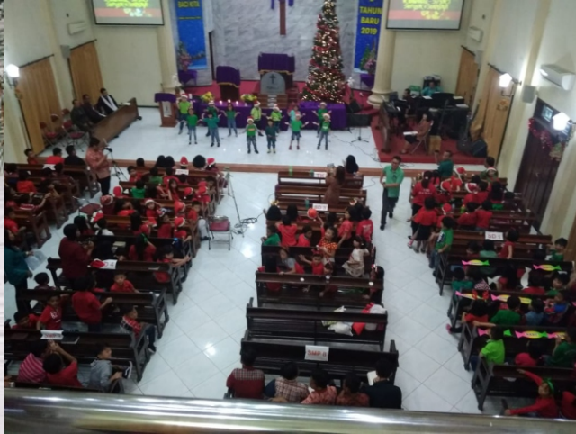
Natal Bersama SD & SMP Kristen YBPK Wiyung