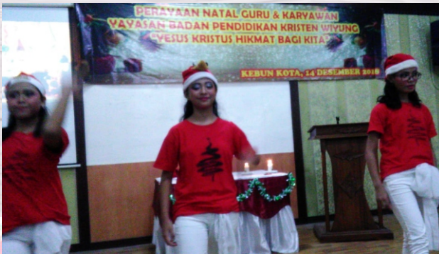
Natal Bersama Karyawan, Majelis GKJW Wiyung dan Guru, Staf YBPK Wiyung