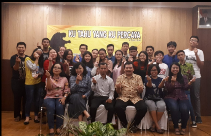
Pembekalan Calon Sidi